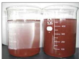
[分散・スケール防止]