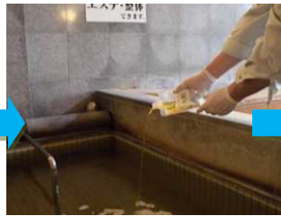
[C 剤で中和・リンス]